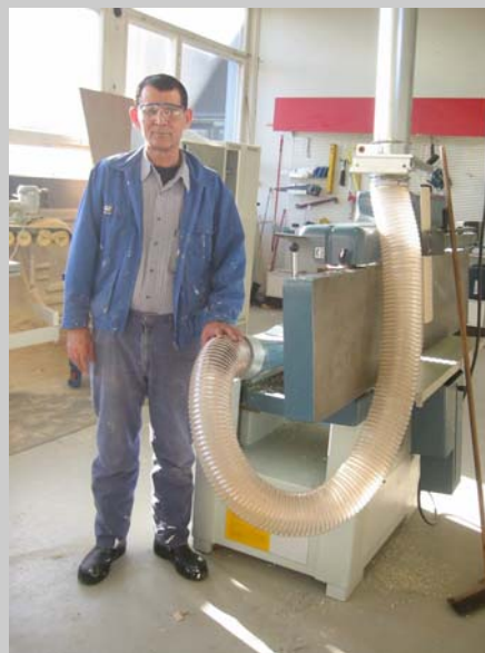
Najar ved høvelmaskin hos GALVANO AS

Her kan du og din bedrift bidra med å omsette flyktningens erfaringer og utdanning til norske forhold.